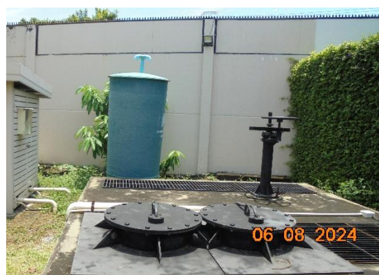
รูปที่ ก-13 ถังดักตะกอนฝอย