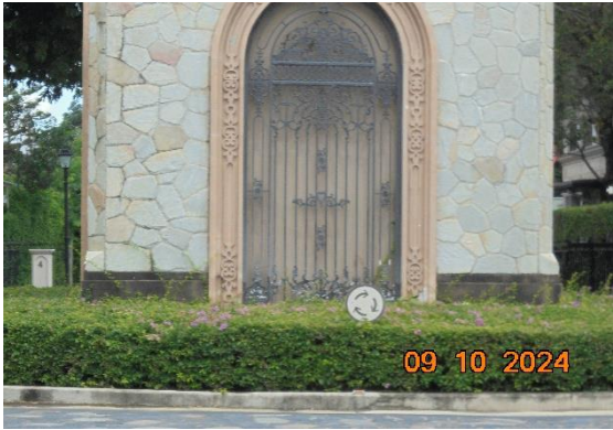
ป้ายเตือนวงเวียน