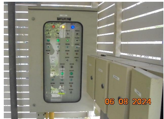
ระบบบำบัดน้ำเสียรวม 2