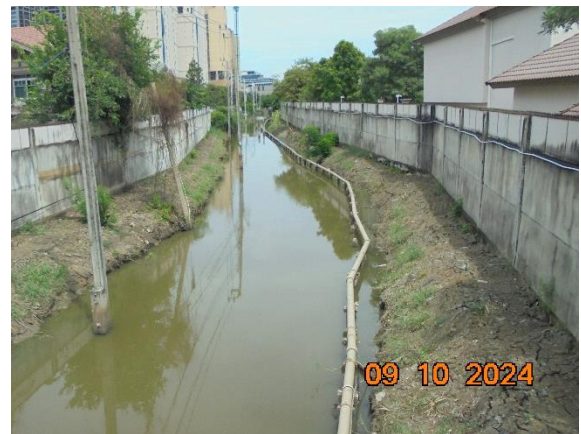
รูปที่ ก-7 ระยะถอยร่นจากแนวเขตคลอง