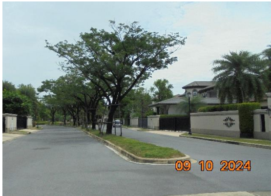
รูปที่ ก-3 การปลูกไม้ยืนต้นชนิดต่างๆ ภายในโครงการ