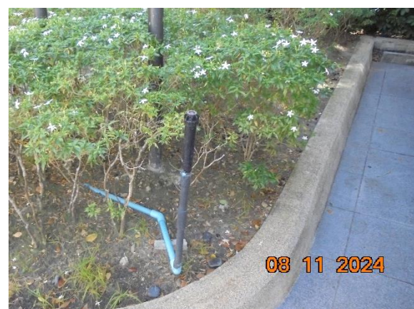
รูปที่ ก-8 น้ำทิ้งสุดท้ายไปใช้ประโยชน์ให้ต้นไม้ในพื้นที่สีเขียว