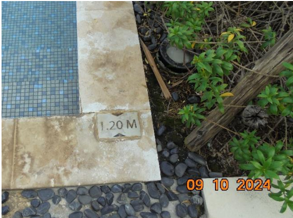
รูปที่ ก-20 ที่บอกความลึกของสระว่ายน้ำ