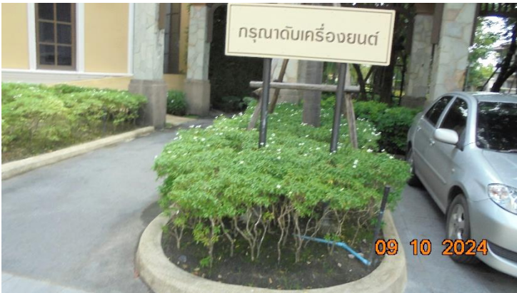
รูปที่ ก-1 ป้ายดับเครื่องยนต์บริเวณที่จอดรถ