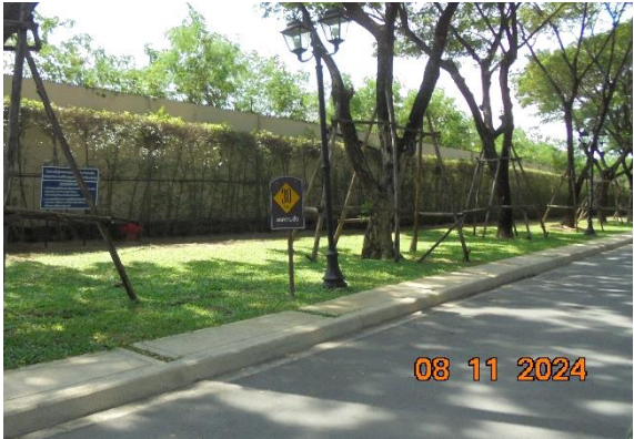
ป้ายจำกัดความเร็ว